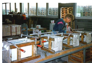
BILZ-Altproduktion: Briefkasten-Sprechanlage-Elemente = Juramarmor + Gussfugen.