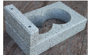
BILZ-Hightech-Torsäulenstein + Blendleiste für Brief- und Sprechanlagekästen.