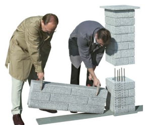
BILZ-Selbstverlegesockel + kleine Säule.