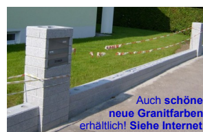
BILZ-Granit-Maueranlage, „noch ohne Zaun“. Auch schöne neue Granitfarben erhältlich! Siehe Internet!