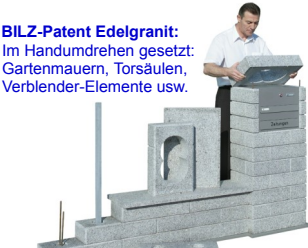
BILZ-Patent Edelgranit: Im Handumdrehen gesetzt: Gartenmauern, Torsäulen, Verblender-Elemente usw.