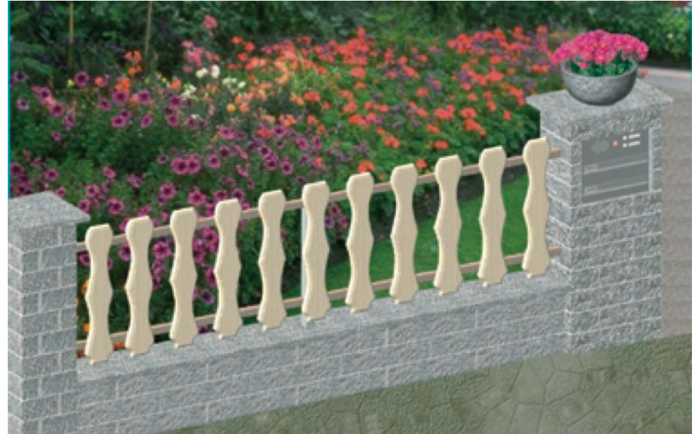
Gleich drei Arbeitsgänge in einem lassen sich mit dem Bilz'schen Granit-Mauersystem erledigen. Sparen Sie sich Vormauern, Verblenden, Verfugen und dabei eine Menge Zeit und Geld.