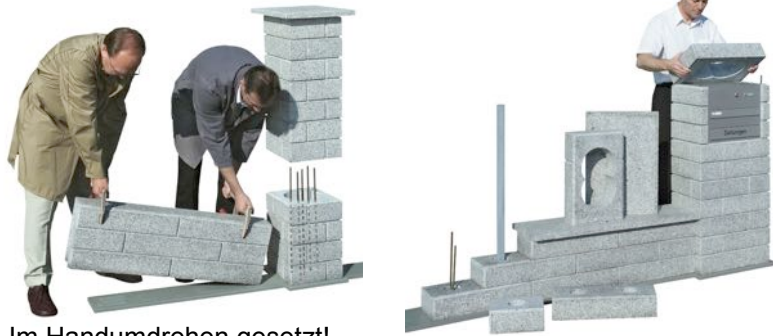
Im Handumdrehen gesetzt!