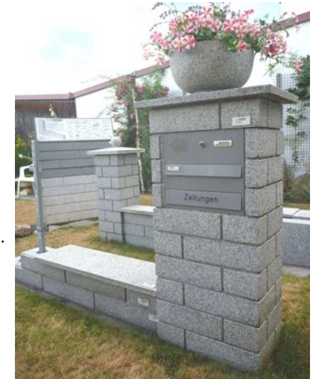
Die BILZ-Schnellbauelemente sind sicher, repräsentativ und schön!

Das edle Material wird kreativ bearbeitet. Oberflächenbeispiele: fein = pflegeleicht, rau = rustikal, bzw. Antik fein, Antik grob, bossiert, poliert usw.