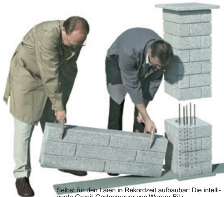
Selbst für den Laien in Rekordzeit aufbaubar: Die intelligente Granit-Gartenmauer von Werner Bilz.