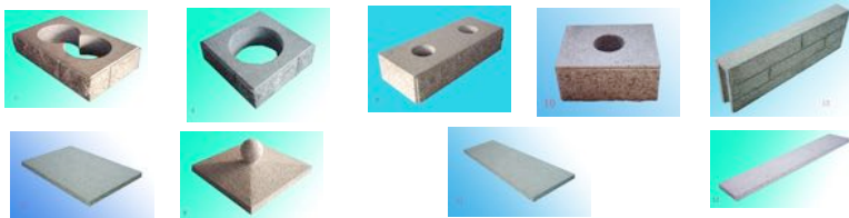
Gartenmauern, Torsäulen, Verblender-Elemente - mit Langzeit-Fräsfugen!